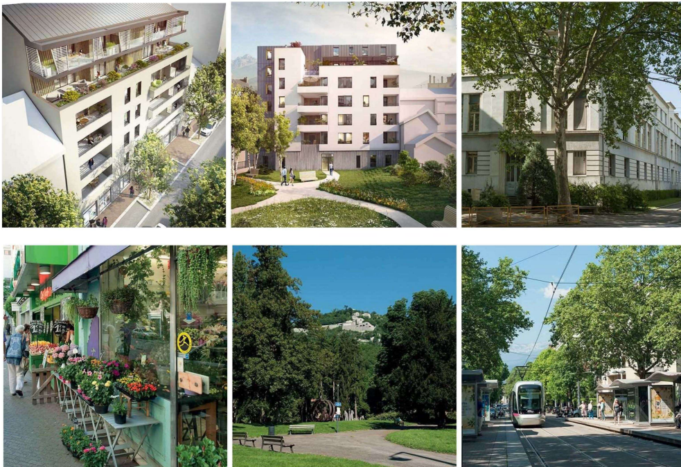
LES JARDINS DE L'ILE VERTE ILE VERTE - GRENOBLE